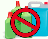
Anticongelante y Pesticidas