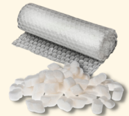
Espuma de poliestireno, película de plástico, bolsas de plástico