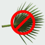
Sin hojas de palma