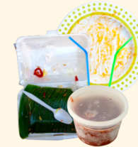
Utensilios de plástico, pajitas, recipientes sucios para llevar