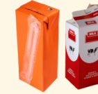
Cajas de jugo y cartones de leche