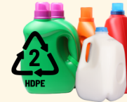
Plástico #2 & #3