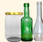
Botellas y frascos de vidrio