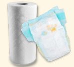
Pañales, servilletas usadas, toallas de papel